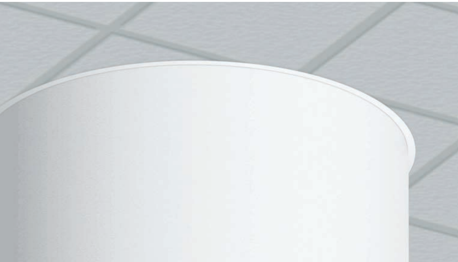
▲ Axiom® Molduras Perimetrales y Anillos de Columna

SUSTAIN™ Sistemas de Plafones Sustentables de Alto Desempeño