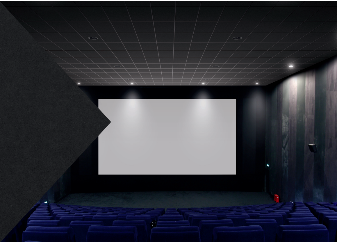
Backstage Noir® de orilla cuadrada con sistema de suspensión Prelude® XL® de 15/16"

Dibujos CAD/Revit® armstrongceilings.com