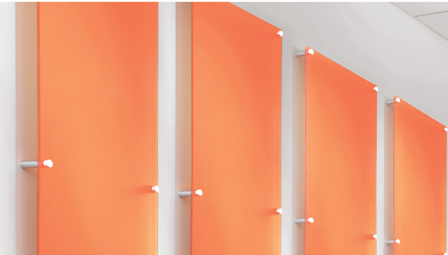
Infusions™ Paneles de 24" x 96" en Refined Tangerine

Sistema de paneles disponible en colores y patrones translúcidos que pueden colgarse individualmente o en grupo.