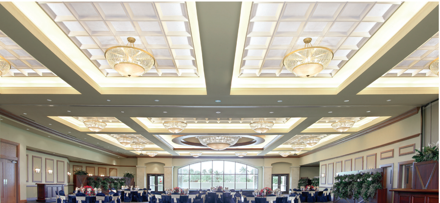
Casetones CastWorks Metaphors Cove con plafones de relleno Ultima® de orilla cuadrada

FAST 134 Selectos artículos envían rápido