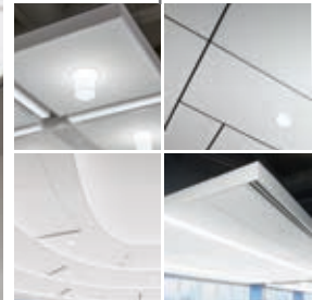
▲ Plafones Optima tegular 24 x 24" con sistema de suspensión Sonata® 9/16"

Los plafones Optima® de textura lisa proporcionan una excelente absorción acústica y más opciones de tamaño estándar que cualquier otra plafón en la línea.