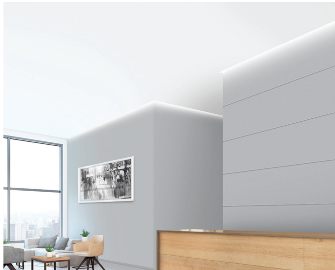
▲ Molduras con ranuras para paredes

Las ranuras para paredes crean una separación horizontal o vertical en paredes de paneles de yeso, lo que facilita las transiciones entre paneles de yeso o entre los paneles de yeso y los paneles ACOUSTIBuilt® para aplicaciones en paredes.