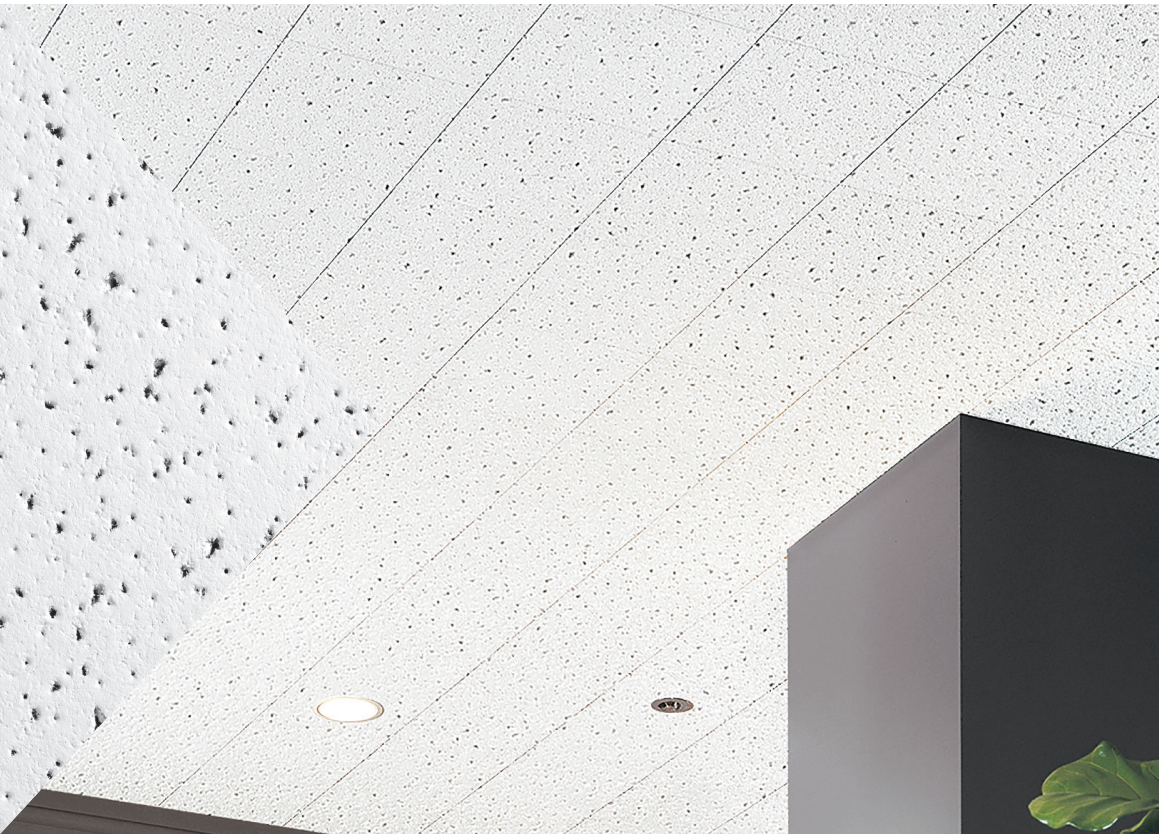
▲ Panneau Fine Fissured MC avec système de suspension Prelude MC Dissimulé de 15/16 po (p. 387)

Dessins CAO/Revit MD sur : armstrongplafonds.ca/caorevit