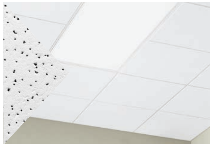
▲ Panneaux Fine Fissured Second Look II avec système de suspension Prelude XL de 9/16 po

Panneaux économiques; Planches rainurées ou visuels géométriques avec des performances acoustiques standard.