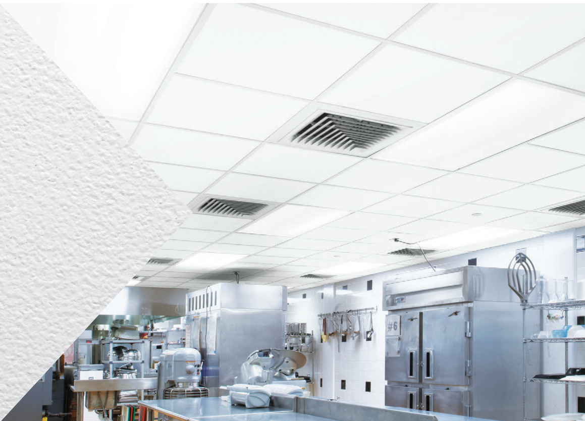
▲ Panneaux Kitchen Zone 24 x 24 po avec système de suspension Prelude SM XL SM de 15/16 po

Dessins CAO/Revit MD sur : armstrongplafonds.ca/caorevit