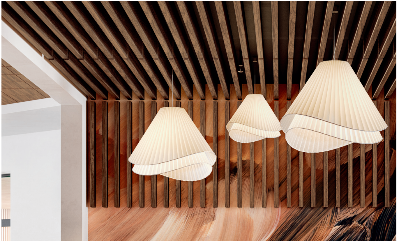
Panneaux de murs SoundScapes Lames d'aspect bois en noyer cassonade (WBS)

VITE134 Certains articles sont vite expédiés armstrongplafonds.ca/vite134