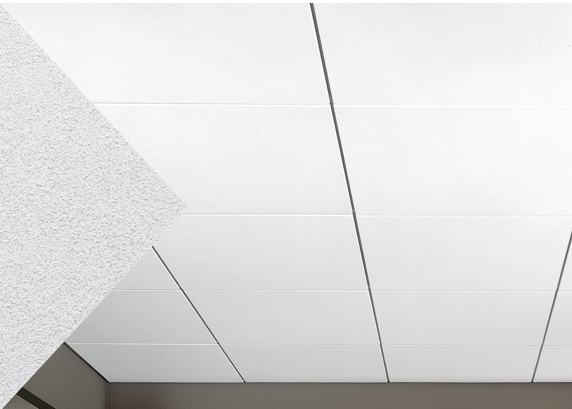
▲ Panneaux Ultima Vector avec système de suspension Prelude MD XL MD de 15/16 po

DESIGNFlex MD Un nouveau monde de choix pour les systèmes de plafond